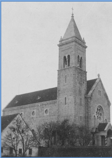
Pfarrkirche im Jahr 1906 nach der Weihe