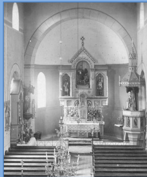
Innenansicht um 1928

Da die alte Pfarrkirche gegen Ende des 19. Jahrhunderts sehr baufällig war, entschloss man sich zum Neubau der Pfarrkirche. Nach jahrelangen Verhandlungen wurde endlich der Neubau von 1904 bis 1906 durchgeführt (Architekt Richard Jordan). Der Bau verlangte der Bevölkerung große Opfer ab.